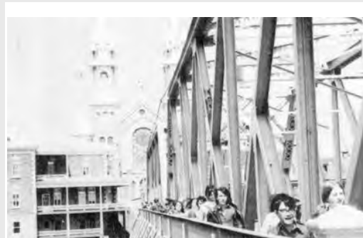
Pont de Saint-Casimir