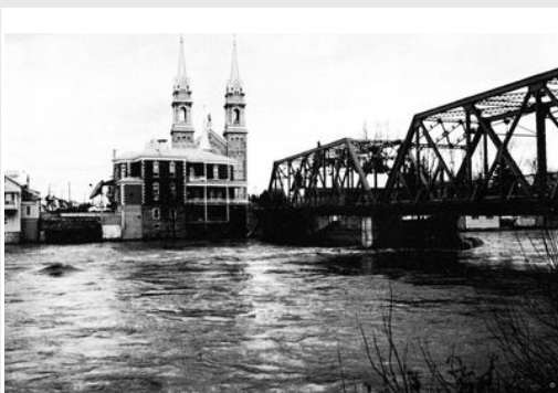
Pont en face de l'église