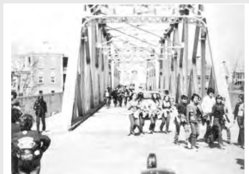
Pont du village